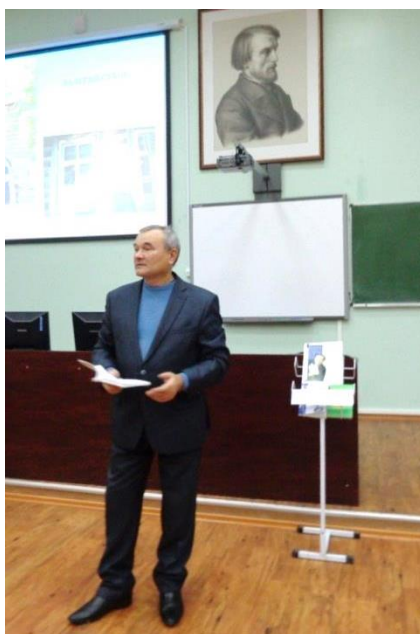
Выступление на юбилейном вечере в Педагогическом институте имени В. Г. Белинского Пензенского государственного университета 25 декабря 2018 года