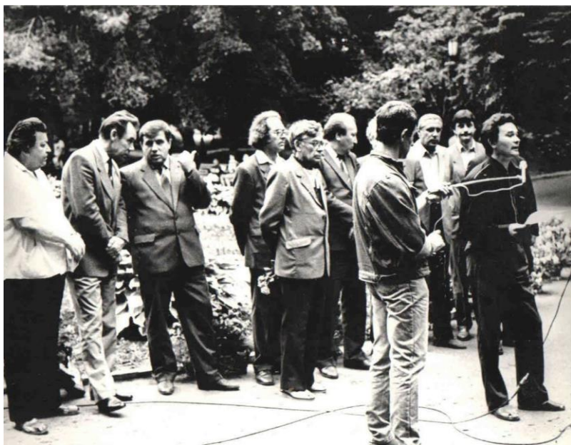
Выступление на Лермонтовском Дне поэзии в Пензе в июле 1990 года