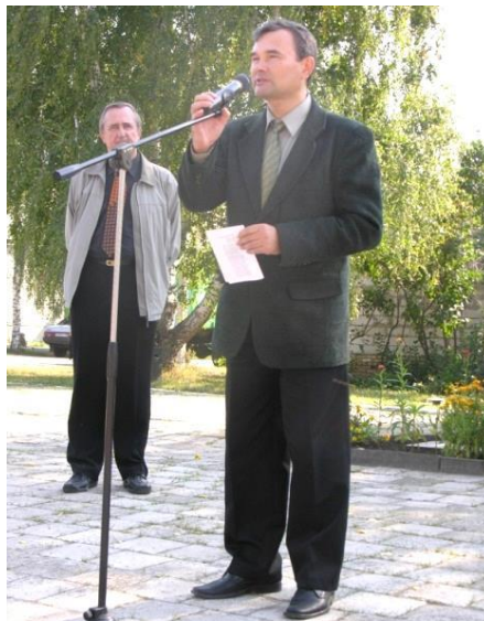
Выступление на Купринском литературном празднике в Наровчате