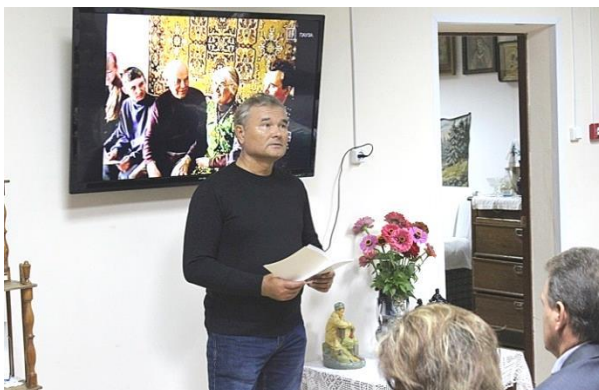
Выступление в Городище на презентации сборника «Материнский оберег» 25 сентября 2018 года