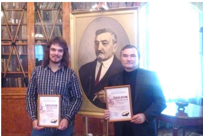
После вручения Купринской премии «Гранатовый браслет» в номинации «Мастер» в Литературном музее города Пензы в августе 2011 года