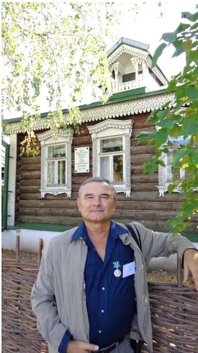
В Константинове после вручения медали «Сергей Есенин» в сентябре 2015 года