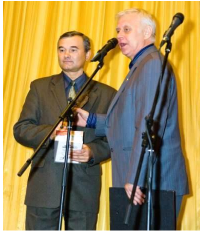
Вручение Международной премии имени С. А. Есенина «О Русь, взмахни крылами...» в Москве в октябре 2010 года