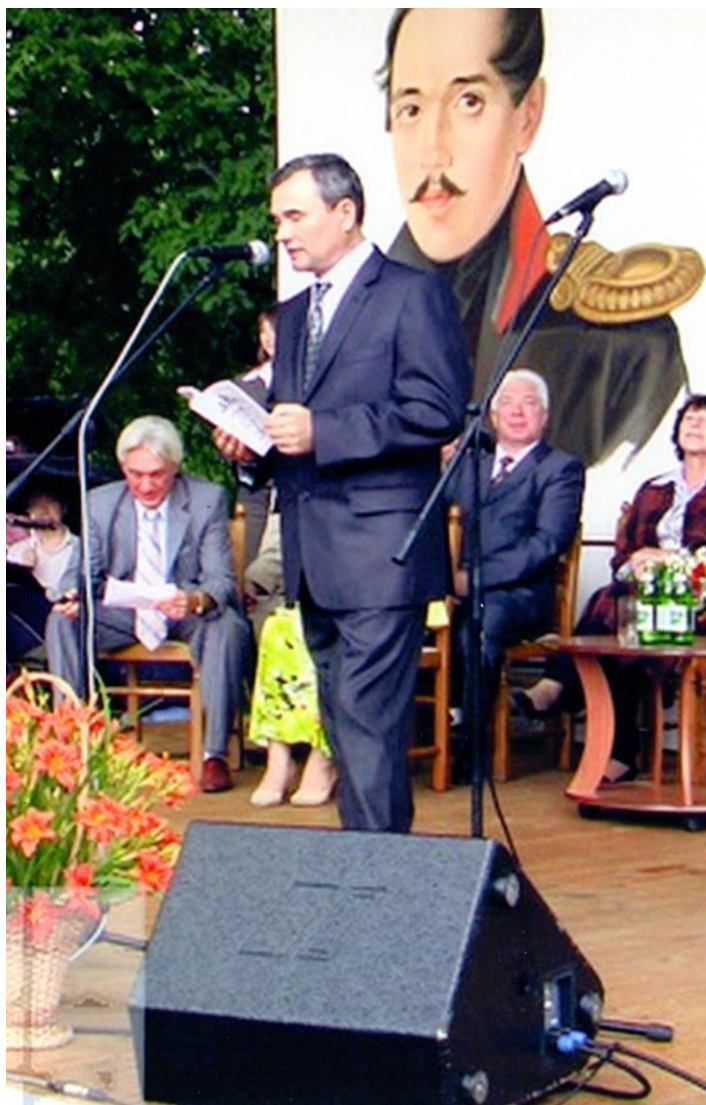
Выступление на Лермонтовском Дне поэзии в Тарханах после вручения Всероссийской премии имени М. Ю. Лермонтова в июле 2009 года